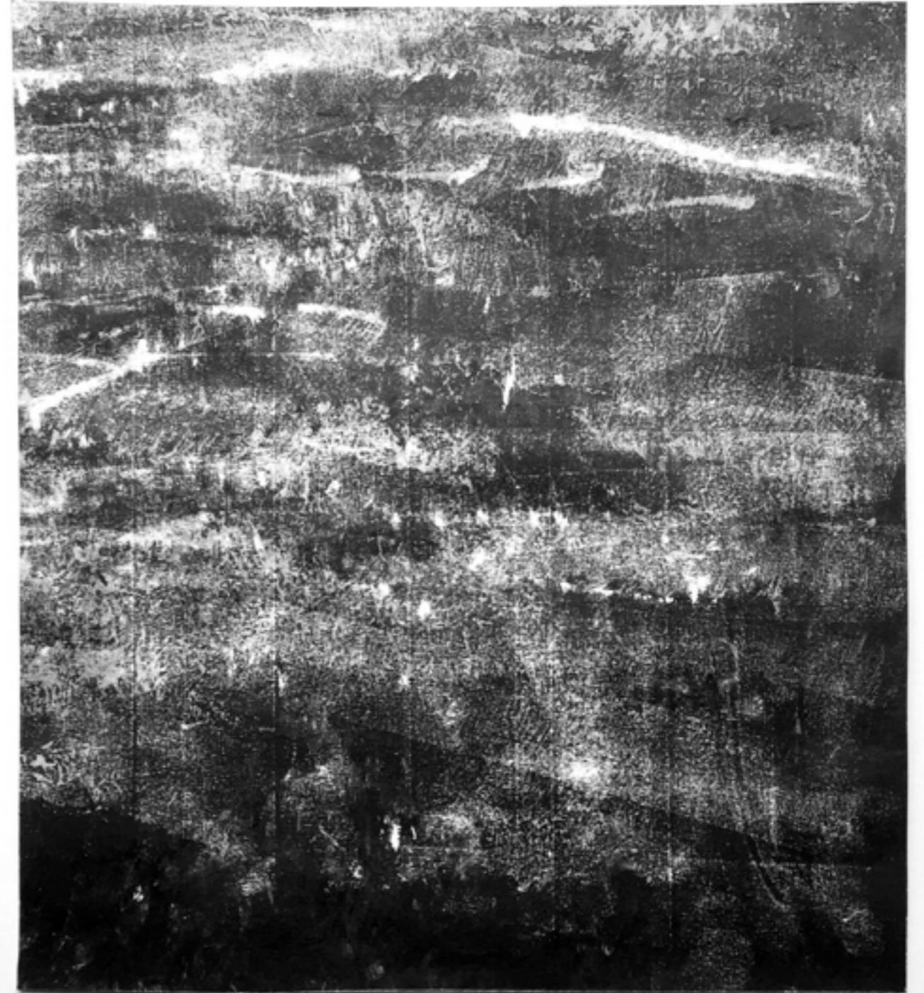
Grey Matter 8_2022 | Graphit auf Papier, 25 x 22 cm >